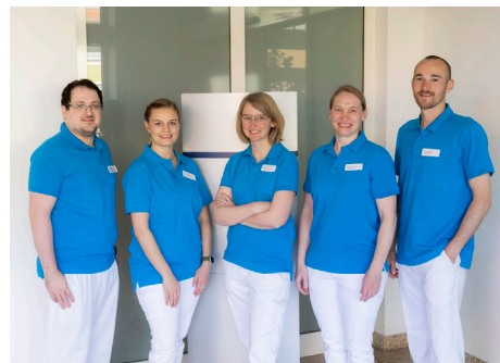
Ihr Team der Physiotherapie des Fachklinikums Mainschleife GmbH

Wir stellen für Sie ein individuelles, interdisziplinär koordiniertes Therapieprogramm nach krankheitsbedingten Vorgaben des behandelnden Arztes entsprechend Ihrer persönlichen Bedürfnisse zusammen. Auch mit Heilmittelverordnungen von externen Ärzte*innen dürfen Sie gerne zu uns kommen. Wir würden uns freuen, Sie bei uns begrüßen zu dürfen, um Ihnen wieder auf die Beine zu helfen und Ihnen ein Stück Lebensqualität zurückgeben zu können.